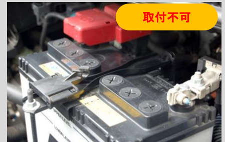
後ろ側が差し込みのタイプ