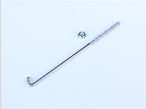
品番 : NP99090 品名 : NEOPLOTバッテリーロッド(SUS304) 180mm 材質 : ステンレス製

純正バッテリーロッドの長さがバッテリー上端(上面)より10mm以上突出していることをご確認ください。10mm以下の場合、確実な固定が出来ないためナット分の長さが確保できるバッテリーロッドに交換する必要があります。車種によっては、別売のNEOPLOTバッテリーロッド(SUS304)を使用することで取り付けが可能となります。