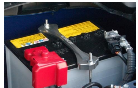
NEOPLOTバッテリーロッド(SUS304) 180mmを使用することで取り付けが可能となります。(Dサイズバッテリー搭載車) ※Bサイズバッテリー搭載車の場合は、ロッド長240mmをお選びください。