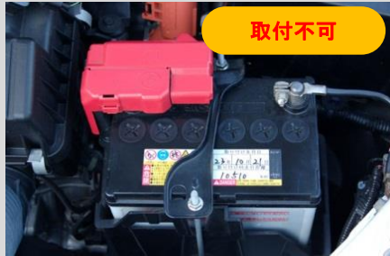
オフセットしているタイプ

現在お車に装着されている純正バッテリークランプが、下記のようなタイプの場合は、NEOPLOTバッテリーホルダーNEOのお取り付けができませんのでご注意ください。