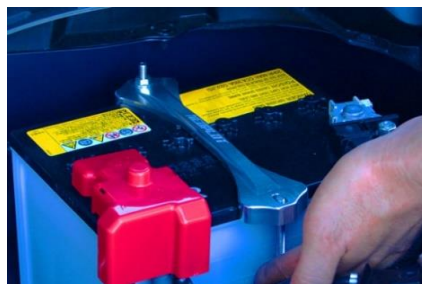
純正バッテリーロッドのままだと、前側のロッドが短いためナットを固定できません。(Dサイズバッテリー搭載車)