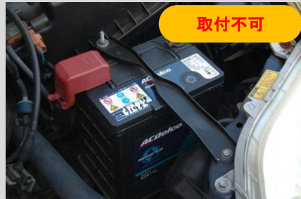
ラジエーターサポートに固定するタイプ