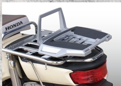
HEPCO&BECKER汎用ベース装着例