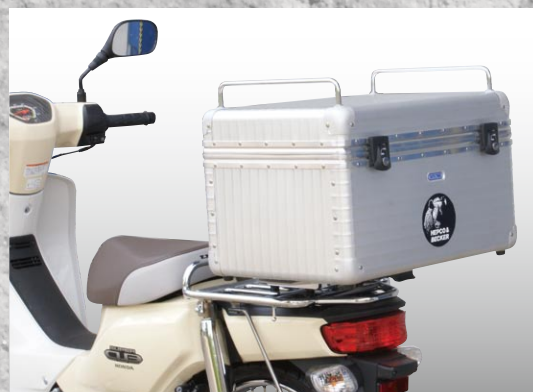
画像はALU EXCLUSIV TC45 装着例