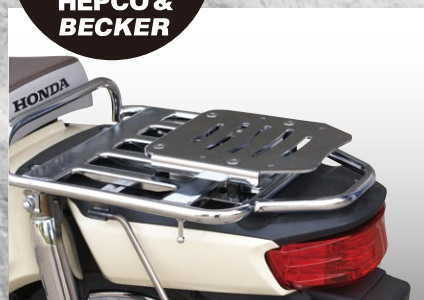
PLOTトップキャリア(純正キャリア用)

HEPCO&BECKER 取付け用キャリア登場! 純正キャリアに、HEPCO&BECKERケースを取付ける為のトップキャリアです。