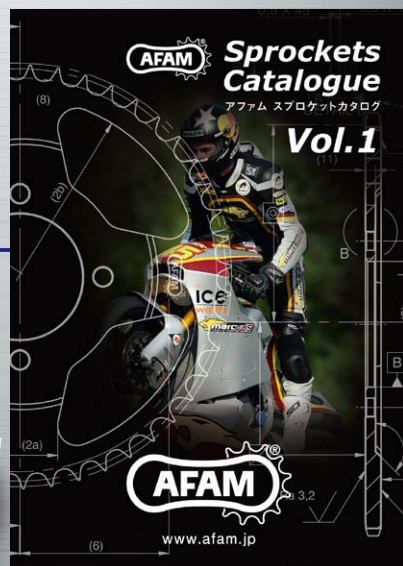
アフアムsprocket カタログ Vol.1 完成