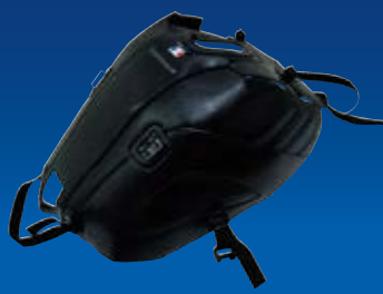
ブラック/アンスラサイト

品番：1735A 価格(税抜)¥25,000 JAN：4550255071127