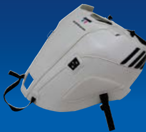
ホワイト/アンスラサイト

品番：1735C 価格(税抜)¥25,000 JAN：4550255071141