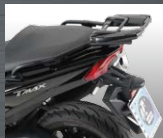
トップケースキャリア Easyラック

ヘプコ&ベッカートップケースを装着できる リアキャリア。積載上限5Kg 品番：6524561-0101 価格(税抜)¥23,500 JAN：4550255002466