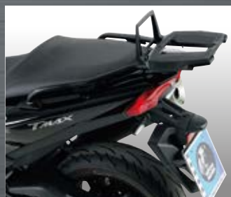
トップケースキャリア アルラック

※装着しているトップケース ジュニアフラッシュ TC55 ブラック×ブラック 品番：610047-0011 価格(税抜)¥40,300 内容量55L JAN：4548664658930