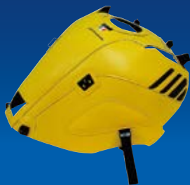
レモンイエロー/ブラック

17-18モデルの純正パターンに対応した3色と黒単色を展開。タンクの保護をしながら、専用のタンクバッグ 装着を可能にします。ツーリング性能を向上させることで永く愛されてきたアイテムです。