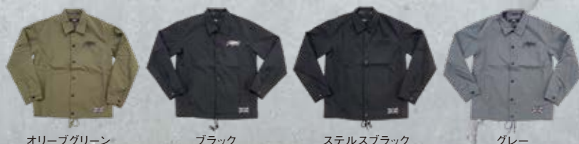
オリーブグリーン