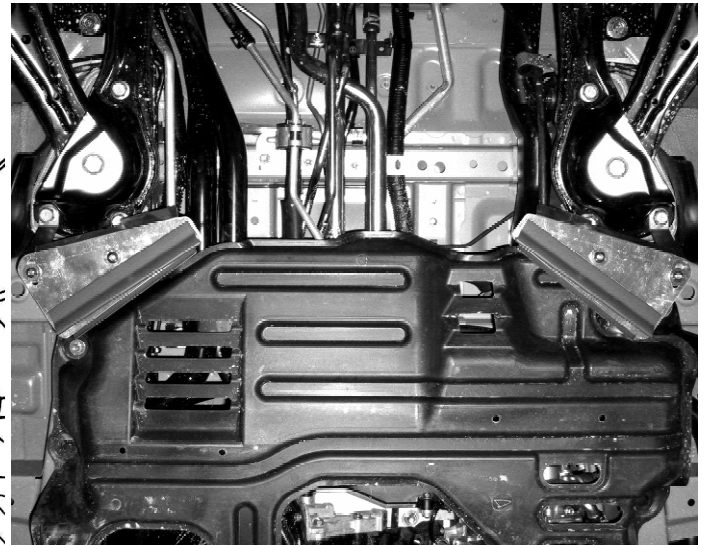
フロントロアアーム メンバーブラケット