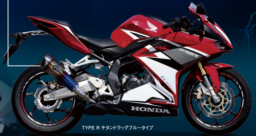
TYPE R チタンドラッグブルータイプ

特に低中回転域では「大幅なトルクアップ」を達成。刺激的な加速性能を体感できる「スポーツマシーン」に変貌します。