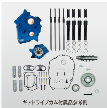
ギアドライブカム付属品参考例

TC3ビレットカムサポートプレート&オイルポンプキットとカムシャフト、タペット、タペットカフスやプッシュロッドをセットにしたお得なキットです。カム交換をする際に押さえておきたい全てのパーツをセット化。WATER COOLEDやOIL COOLED、ギアまたはチェーンカム、プッシュロッドのカラーなど選択可能です。カム交換する際に必要なガスケットやインナーカムベアリングなども付属しているので追加パーツや加工は必要ありません。全てのパーツを各々で購入するより断然お得です!