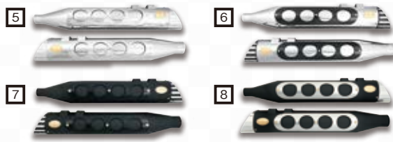
Vanquishスリップオン 専用のインバクトヒート シールド *写真はポリッシュ仕上げ

一般公道使用不可 このマフラーは海外へも販売しており、日本国内の規制対応には合わせておりません。