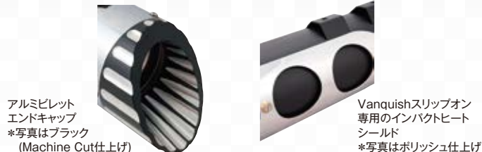
アルミベレット エンドキャップ *写真はブラック (Machine Cut仕上げ)