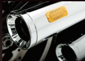
ELIMINATOR 300装着イメージです。

近年人気の高いラインナップより、ハイアウトブツスリップオン(ツーリング用)、エリミネーター 300スリップオン(M8 ソフトテイル用)、ハイアウトブツスリップオン(M8 ファットボブ用)、ショートショットスタッガード(スポーツスター用)に40周年記念ゴールドエンブレムを採用!ゴールドのエンブレムには40周年記念として、「40th ANNIVERSARY VANCE & HINES SINCE 1979」を記載されています。