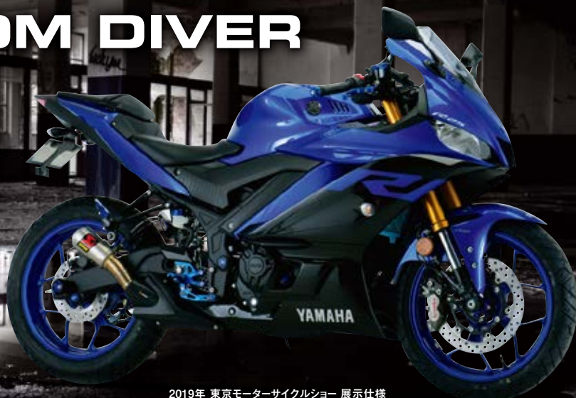
2019年 東京モーターサイクルショー 展示仕様