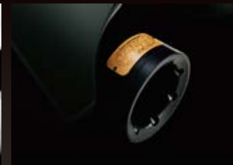
TOURING用HI-OUT PUT装着イメージです。