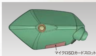
LEDインジケーター搭載 動作状況を確認が可能