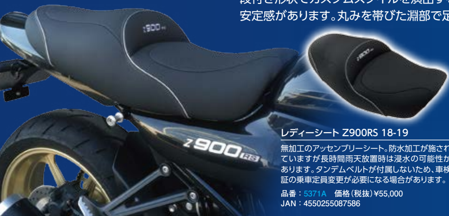
レディーシート Z900RS 18-19

段付き形状でカスタムスタイルを演出するコンプリートシートです。乗車時の引っ掛かりが良く、安定感があります。丸みを帯びた淵部で足つきの向上も期待できます。