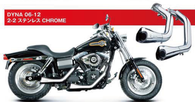
DYNA 06-12 2-2 ステンレス CHROME