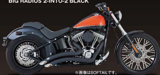
BIG RADIUS 2-INTO-2 BLACK