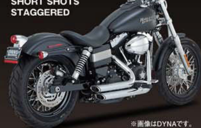
SHORT SHOTS STAGGERED