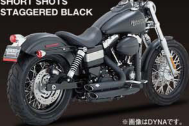
SHORT SHOTS STAGGERED BLACK