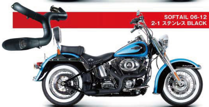
SOFTAIL 06-12 2-1 ステンレス BLACK