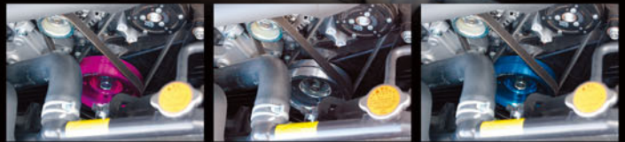
●素材：ジュラルミン / アルマイト処理 ●その他：特殊工具用サービホール付

純正比1/3以下の軽量化を実現したジュラルミン製のクランクプーリーです。この軽量化によりエンジンレスポンスが向上。発進加速のときや、コーナーの立ち上がり時に、そのレスポンスが体感できます。発進時のアクセル開度が少ない分だけ、燃費にも貢献しますので省燃費運転を心掛ける方にもお勧めできるアイテムです。