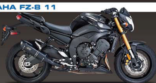
CS ONE BLACKOUT SLIP-ON