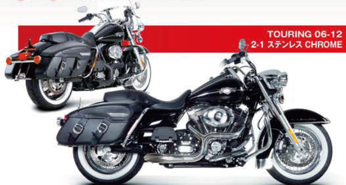
TOURING 06-12 2-1 ステンレス CHROME