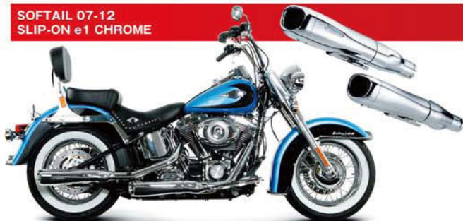
SOFTAIL 07-12 SLIP-ON e1 CHROME