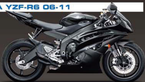
CS ONE URBAN BRAWLER BLACK SLIP-ON