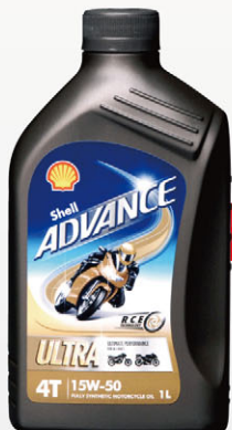
プロトニュース193号でご案内の新デザイン樹脂ボトル