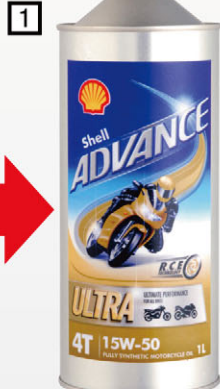
日本仕様のスチール缶 ※今後この仕様となります。