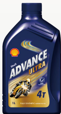
従来の樹脂ボトル