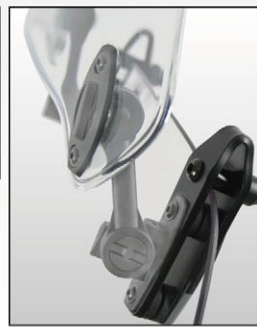
マウンティングキット使用例(+ヒンジS)