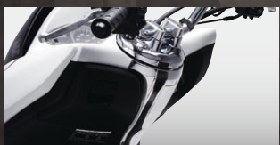
X-SPEED メーターアンダーカバー