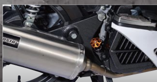
X-SPEED スイングアームカバー

12ヶ×11g 25mm 加速力アップと最高速アップ を両立し、あなたのバイクを確実に速くします。