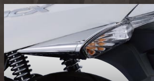
X-SPEED リアウィンカーカバー

カラー：クローム 年式適合：PCX125/150 10-13 品番：PCX-PT-61-CRA 価格(税込)¥3,675 価格(本体)¥3,500