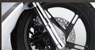
X-SPEED フロントフォークカバー

カラー：クローム 年式適合：PCX125/150 10-13 品番：PCX-PT-62-CRA 価格(税込)¥5,670 価格(本体)¥5,400