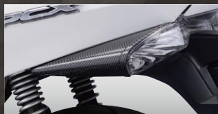
X-SPEED リアウィンカーカバー

カラー：カーボンルック 年式適合：PCX125/150 10-13 品番：PCX-PT-08-KL 価格(税込)¥1,995 価格(本体)¥1,900