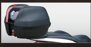
HEPCO&BECKER トップキャリア+トップケースセット