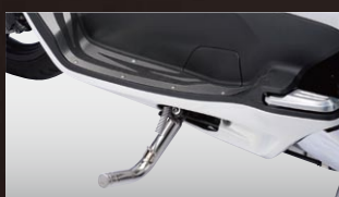
X-SPEED ファットサイドスタンド

カラー：シルバー 年式適合：PCX125/150 10-13 品番：STAN-XS-01-SL 価格(税込)¥5,775 価格(本体)¥5,500