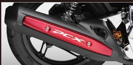
H2C マフラープロテクター

カラー：レッド 年式適合：PCX125 12-13 品番：08F88KWN720 カラー：シルバー 年式適合：PCX125 12-13 品番：08F88KWN740 カラー：グレー 年式適合：PCX125 12-13 品番：08F88KWN760 価格(税込)¥4,095 価格(本体)¥3,900