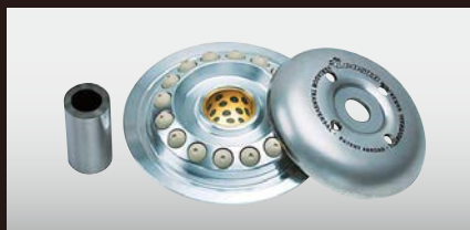
J.COSTA トランスバーサルバリエーター