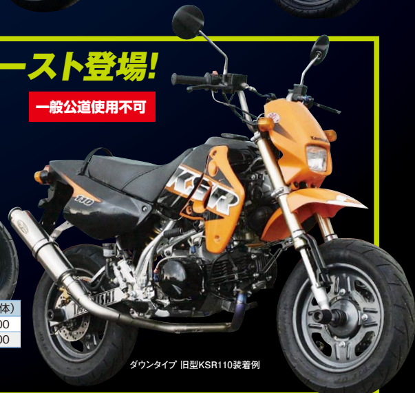
ダウンタイプ 旧型KSR110装着例