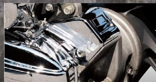
X-SPEED センサープロテクター

カラー：クローム 年式適合：PCX125 10-11 品番：PCX-PT-60-CRA 価格(税込)¥3,675 価格(本体)¥3,500