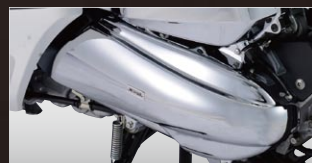
X-SPEED クランクケースカバー