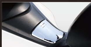
X-SPEED フューエルリッドカバー