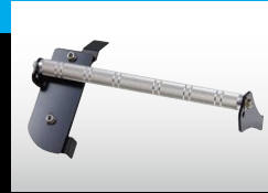
ハイエース ワイド幅ボディ車用(品番:DFRB4062)

フットレストバーは、シューズソールを平面で受ける一般的なフットレストと違い、フットレストバーを起点に左足(首)の動きに自由度があります。これによりドライバーにとって、もっとも自然な姿勢を維持することができますので、ロングドライブ時における疲労の軽減にもつながります。