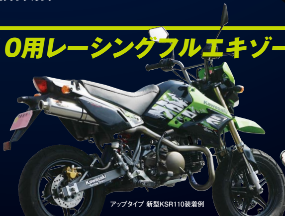
アップタイプ 新型KSR110装着例

従来モデルでパワーと音に定評のあったFASARM M TITAN が新型KSR110にも対応して登場! ノーマルエンジンからチューンドエンジンまで幅広く対応するレース専用エキゾーストシステムです。アップタイプとダウンタイプの2モデルを設定し、お好みのスタイルに合わせてお選びいただけます。JMCA認定モデルは鋭意開発中です。