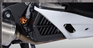
X-SPEED ラジエータカバー