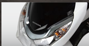
H2C フロントボディカバー