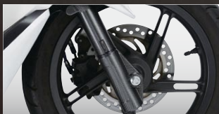
X-SPEED フロントフォークカバー

カラー：カーボンルック 年式適合：PCX125/150 10-13 品番：PCX-PT-05-KL 価格(税込)¥2,940 価格(本体)¥2,800