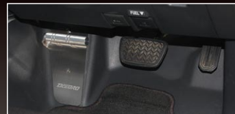
FJクルーザー装着イメージ(品番:DFRB4065)