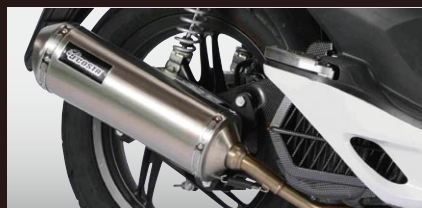
J.COSTA フルEX エキゾーストシステム

12ヶ×8.5g 25mm 加速力アップと最高速アップを両立し、 あなたのバイクを確実に速くします。