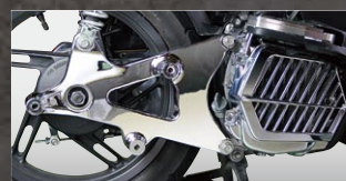
X-SPEED スイングアームカバー