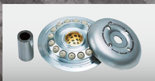
J.COSTA トランスバーサルバリエーター