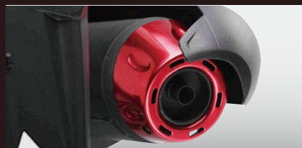
H2C マフラーエンドカバー

カラー：レッド 年式適合：PCX125 12-13 品番：08F53KV8720 カラー：シルバー 年式適合：PCX125 12-13 品番：08F53KV8740 カラー：グレー 年式適合：PCX125 12-13 品番：08F53KV8760 価格(税込)¥2,100 価格(本体)¥2,000