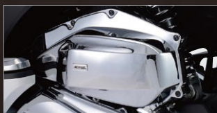
X-SPEED エアクリーナーカバー