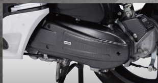
X-SPEED クランクケースカバー

カラー：カーボンルック 年式適合：PCX125 10-11 品番：PCX-PT-10-KL 価格(税込)¥2,940 価格(本体)¥2,800