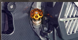
X-SPEED ビレットオイルレベルゲージ