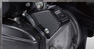
X-SPEED センサープロテクター

カラー：カーボンルック 年式適合：PCX125 10-11 品番：PCX-PT-09-KL 価格(税込)¥1,995 価格(本体)¥1,900