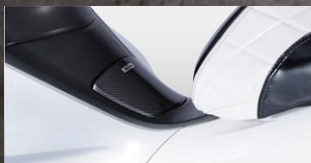
X-SPEED フェUELリッドカバー

カラー：カーボンルック 年式適合：PCX125 10-11 品番：PCX-PT-01-KL 価格(税込)¥1,260 価格(本体)¥1,200