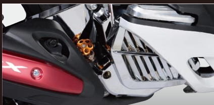
X-SPEED ラジエータカバー

カラー：クローム 年式適合：PCX125 12-13 品番：PCX-PT-54-CR 価格(税込)¥5,670 価格(本体)¥5,400