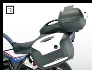
12 ヘブコ&ベッカー 3boxセット