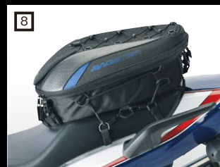
8 BAGSTER スパイダー