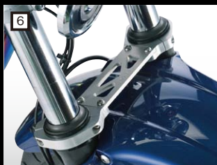
6 PLOT スタビライザー

ハンドルバー等に取り付けるU字クランプと電子機器を固定するXグリップ(標準アーム)とのセット。