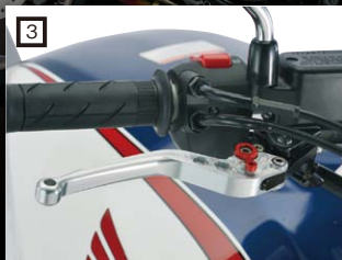
3 LSL レバー

内部のバランサーがハンドルに伝わる細かい振動を吸収します。6色のカラーバリエーションがございます。