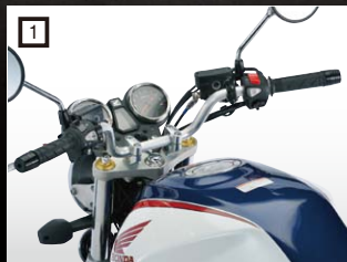
1 EFFEX ハンドル 15年1月下旬発売予定

車種専用ハンドル、グリップ部分が手前に移動したリラックスポジション。ブラック、ゴールドもあります。その他、High(¥5,800税抜)もあります。