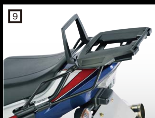
9 ヘブコ&ベッカー リアキャリア