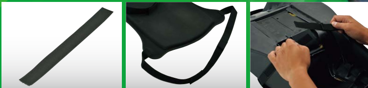
最大で約200mmの延長が可能。

ハーレーダビッドソン ツーリングモデルやBMW R1200GS、カワサキ ZX-14R、スズキ B-KING等の大型シートにも対応。