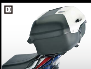
10 ヘブコ&ベッカー トップボックス