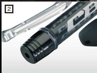
2 EFFEX パーウエイト

車種専用ハンドル、グリップ部分が手前に移動したリラックスポジション。ブラック、ゴールドもあります。その他、High(¥5,800税抜)もあります。