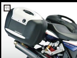
11 ヘブコ&ベッカー サイドボックス