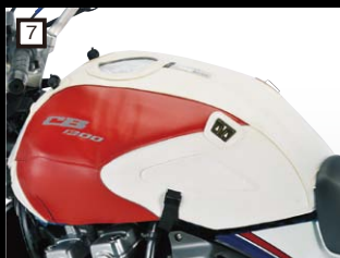
7 BAGSTER タンクカバー